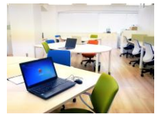
コレンドカレッジ門前仲町